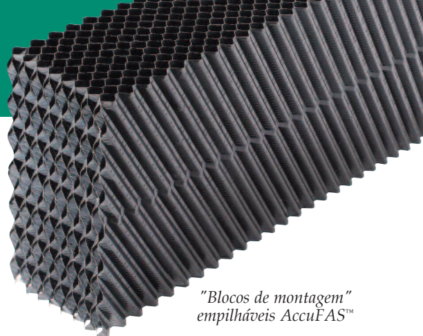
“Blocos de montagem” empilháveis AccuFAS™

As chapas de PVC estruturadas de fluxo cruzado do módulo AccuFAS (acima) são projetadas para maximizar o desempenho da mistura de fluidos e a transferência de oxigênio através da biomassa nas paredes dos meios filtrantes. E os módulos AccuFAS são compatíveis com os difusores de bolha fina para uma transferência de oxigênio mais eficaz.